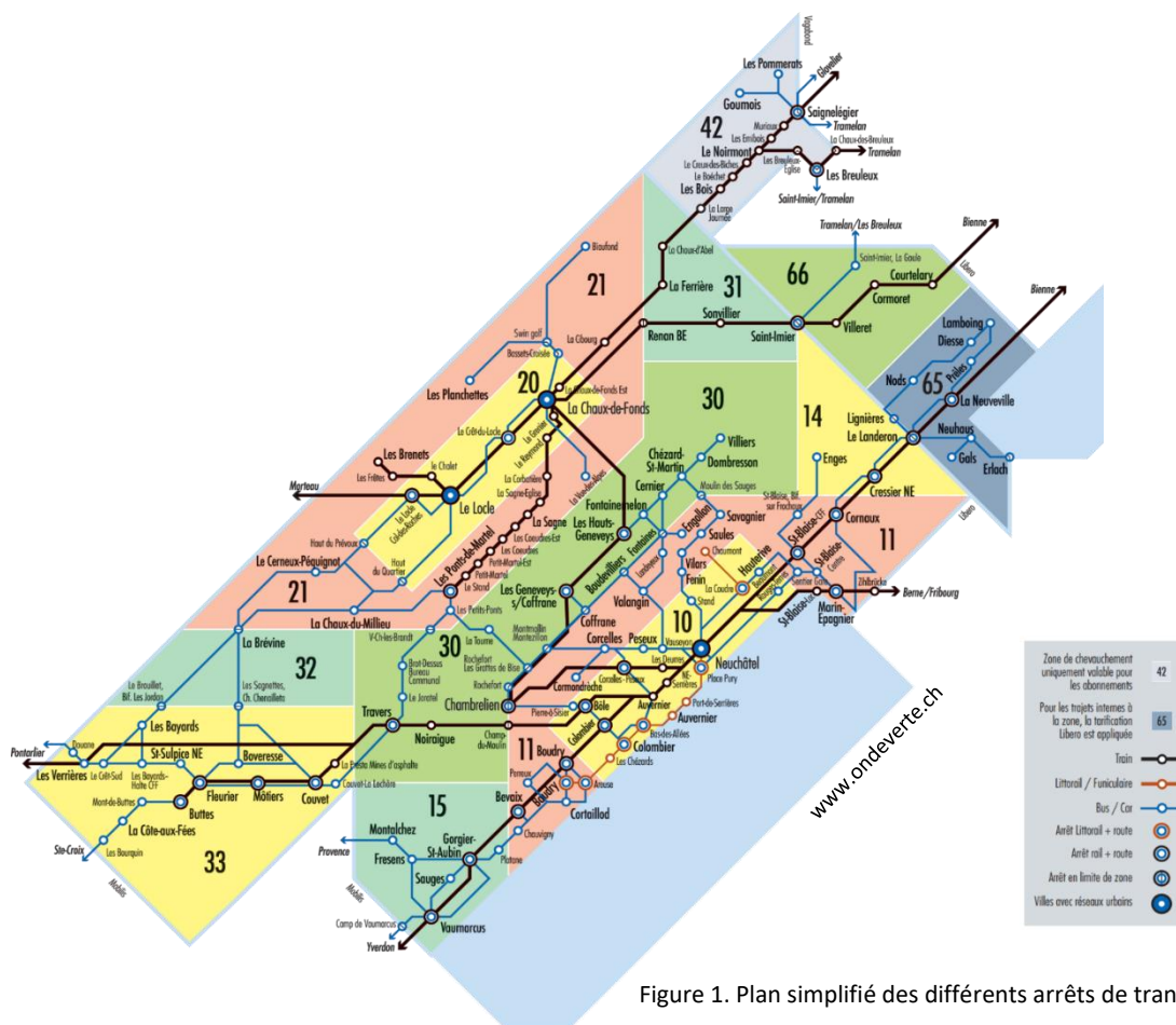
Figure 1. Plan simplifié des différents arrêts de transports publics du canton.

Nous constatons que le prix des parcours simples ne cesse d'augmenter alors que celui des abonnements se limite à un maximum 5 zones.