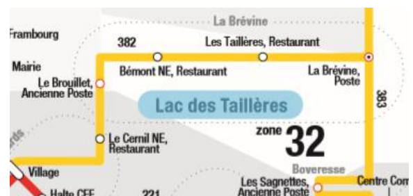
Figure 2. Zone 32, tirée du plan des zones détaillé (en annexe). Les cercles orange représentent les arrêts chevauchant deux zones.

La zone de La Brévine (32) est le meilleur exemple, puisqu'elle contient 3 arrêts chevauchants sur 5 (voir Figure 2. ci-contre). Sa seule utilité est donc de faire payer un prix plus élevé aux personnes qui la traversent, par exemple pour se déplacer de la zone de l'ouest du Val-de-Travers (33) jusqu'à la Chaux-de-Fonds (20, 21) ou jusqu'au Val-de-Ruz (30). Les zones situées en périphérie des villes de Neuchâtel et de la Chaux-de-Fonds ont également peu de raisons d'exister ; le système tarifaire actuel indique que le prix est le même si l'on voyage dans une ou deux zones. De plus, elles ne comportent que peu d'arrêts, dont certains uniquement sur demande (voir Plan des zones détaillé en annexe) souvent chevauchants.