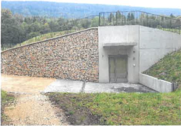
Station de pompage de Fontaine-André