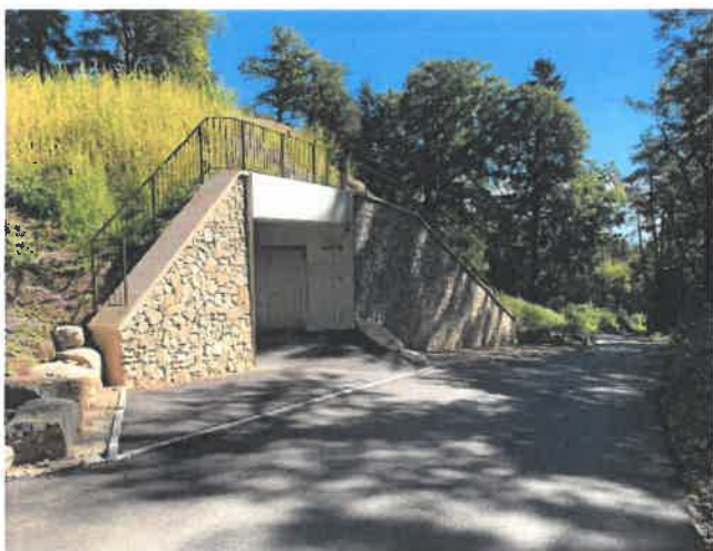
Réservoir de l'Essert

Les quelques illustrations qui suivent permettent de se rendre compte de l'ampleur des travaux déjà réalisés depuis 2020 de Fontaine-André à Combazin.