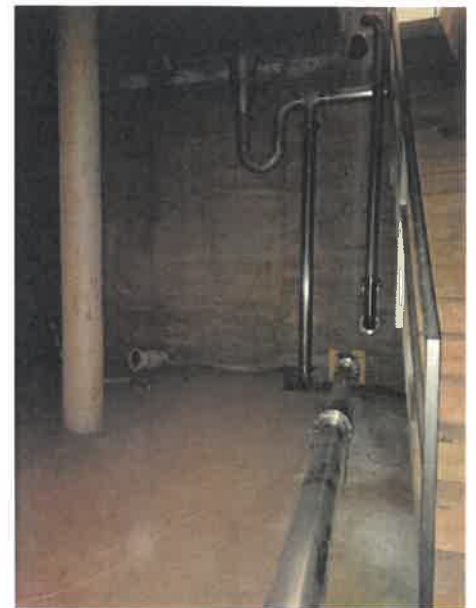
Réservoir des Aiguedeurs